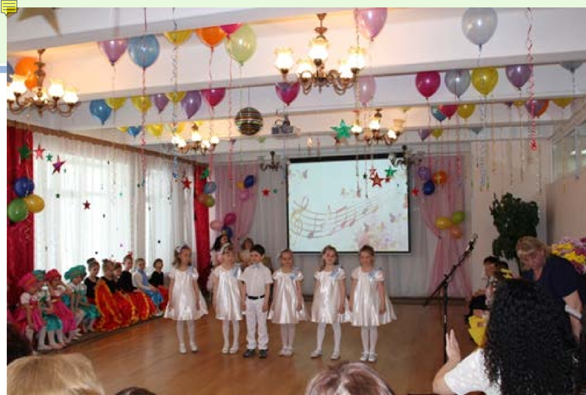
«Нотная песенка» ГБДОУ № 32