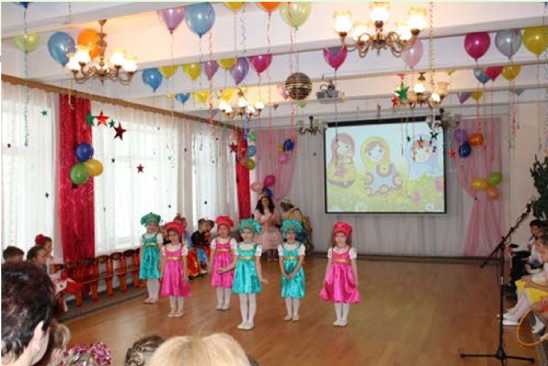
Танец «Матрёшки» ГБДОУ № 111