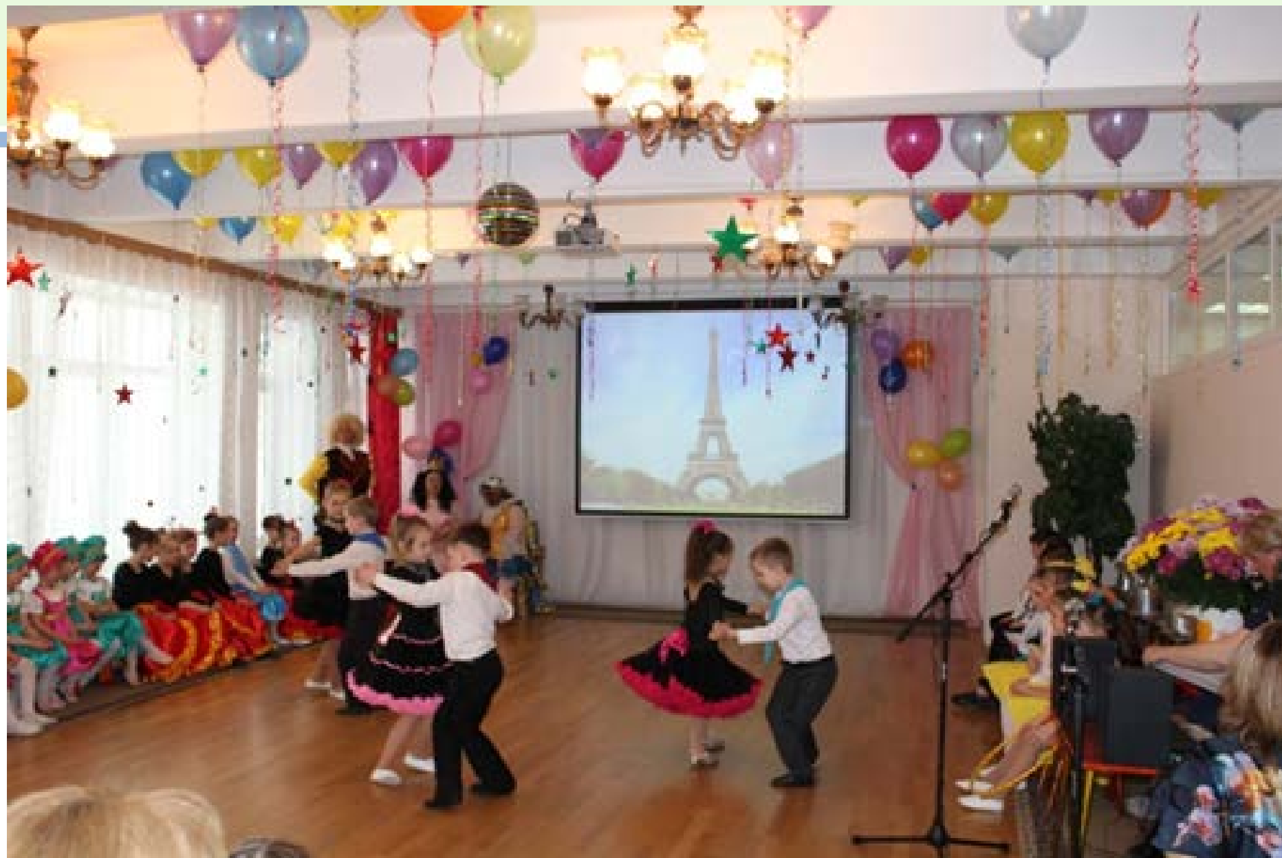
«Танго в Париже» ГБДОУ № 126