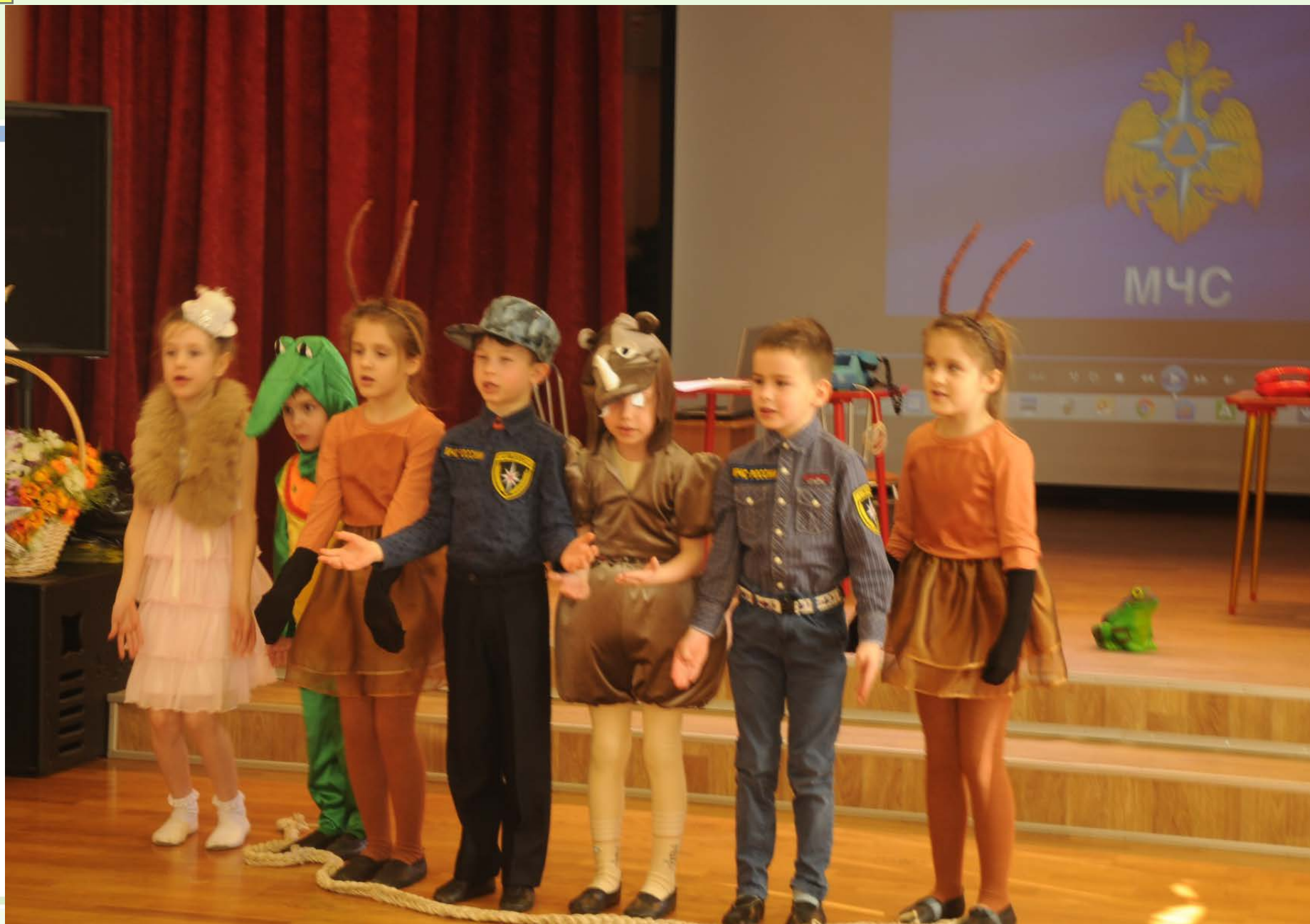
Драматизация «Телефон.RU» ГБДОУ № 107