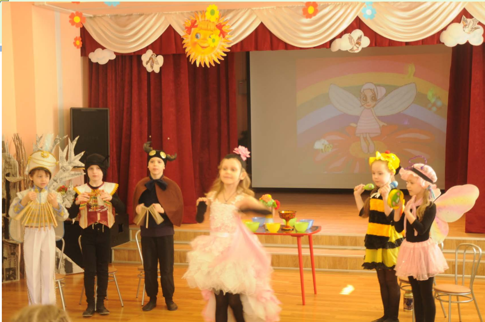
Мюзикл «Муха-Цокотуха» ГБДОУ № 126