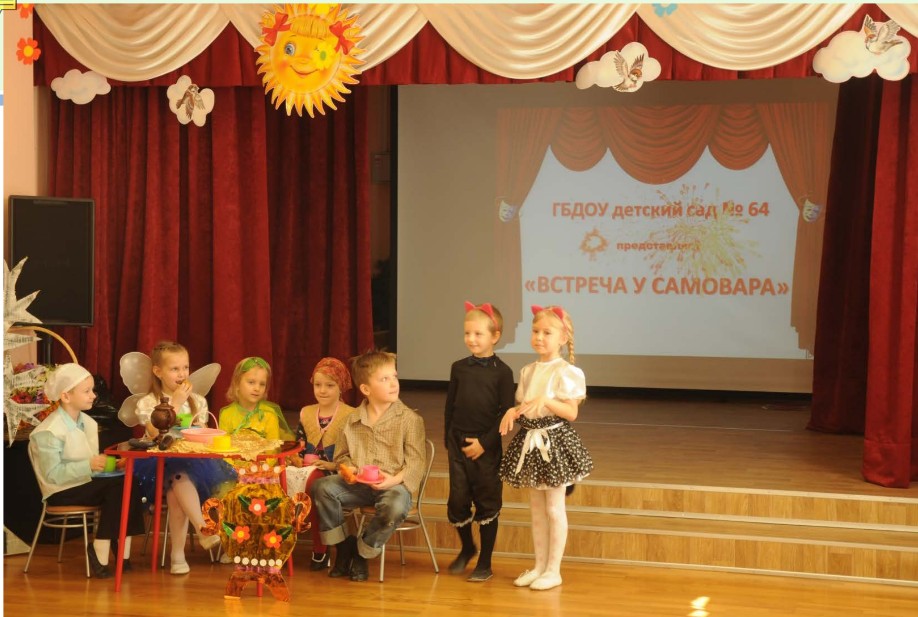
Музыкально-театральная постановка «Встреча у самовара» ГБДОУ № 64