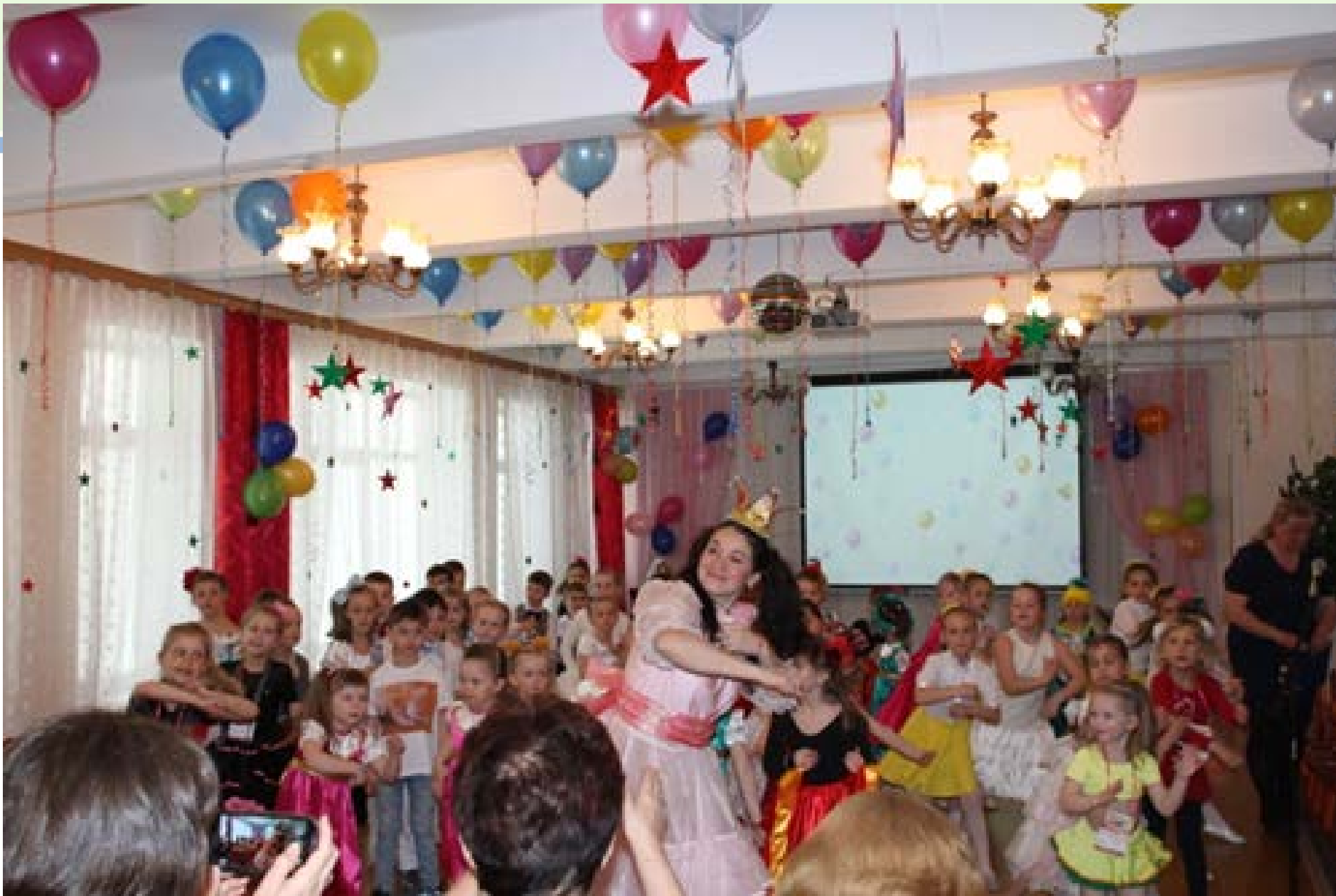
«Весёлый танец с Принцессой»