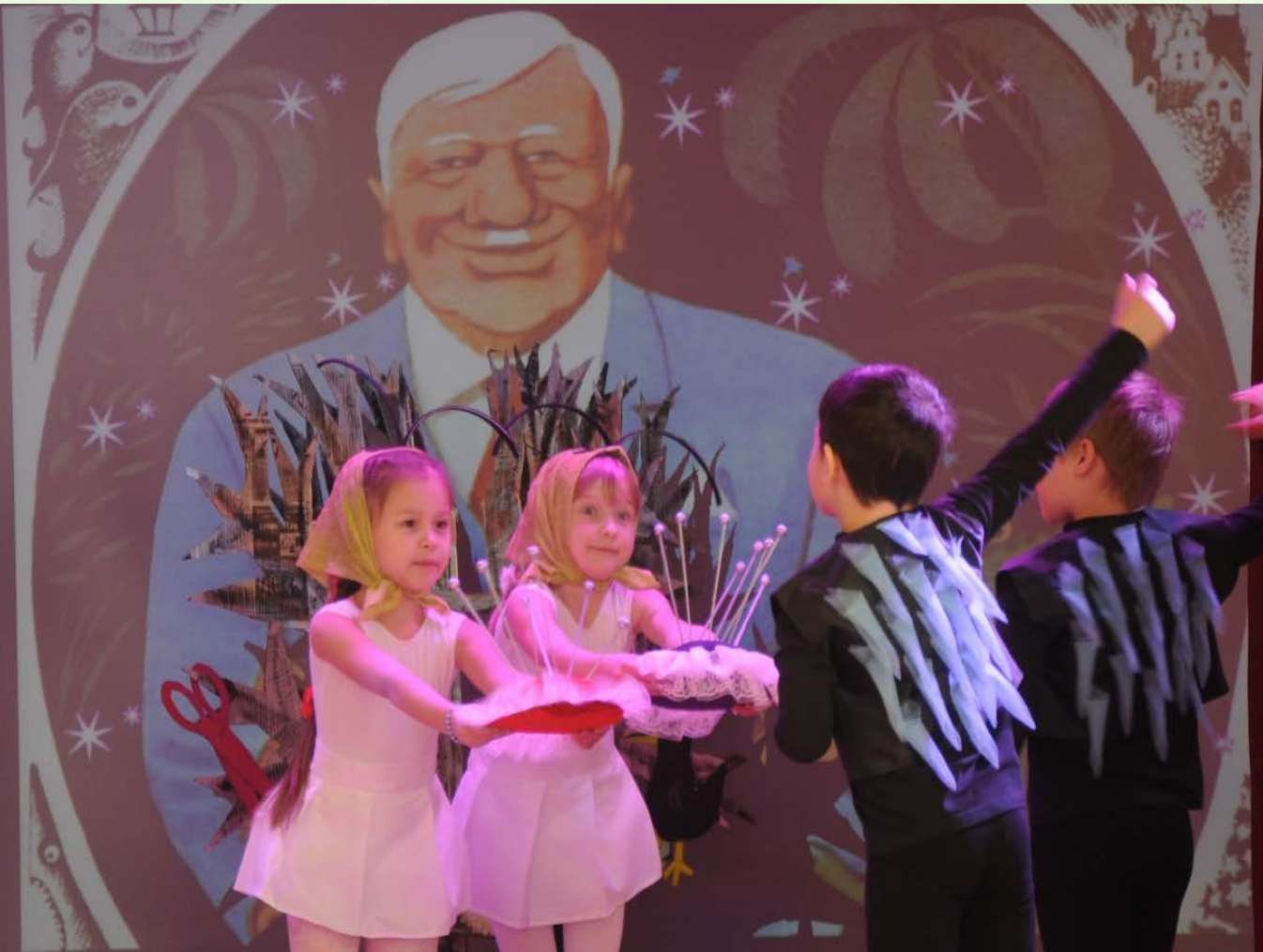
Театральная постановка «Мой Чуковский» ГБДОУ № 32