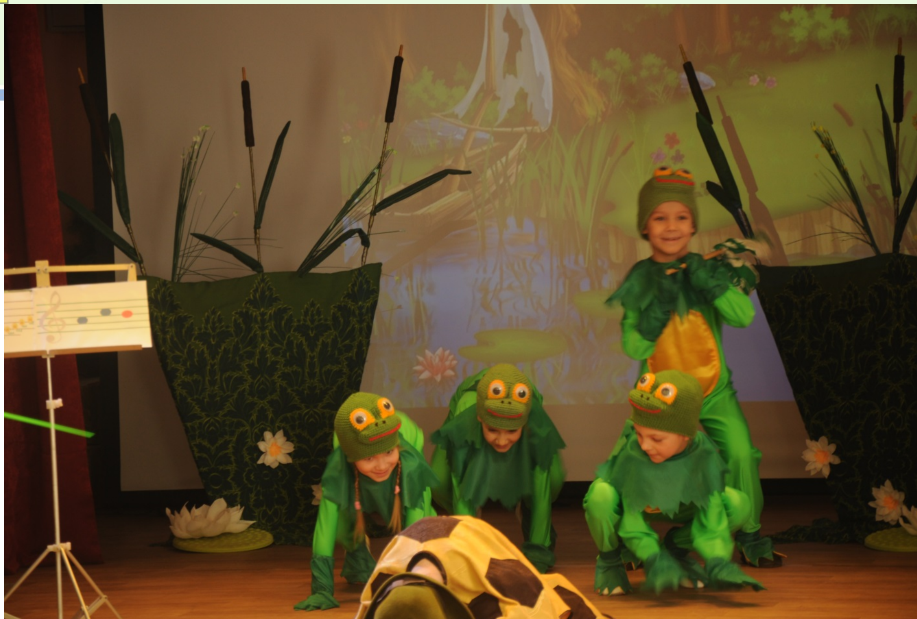
Танцевально-театральная постановка «Черепаша» ГБДОУ № 111