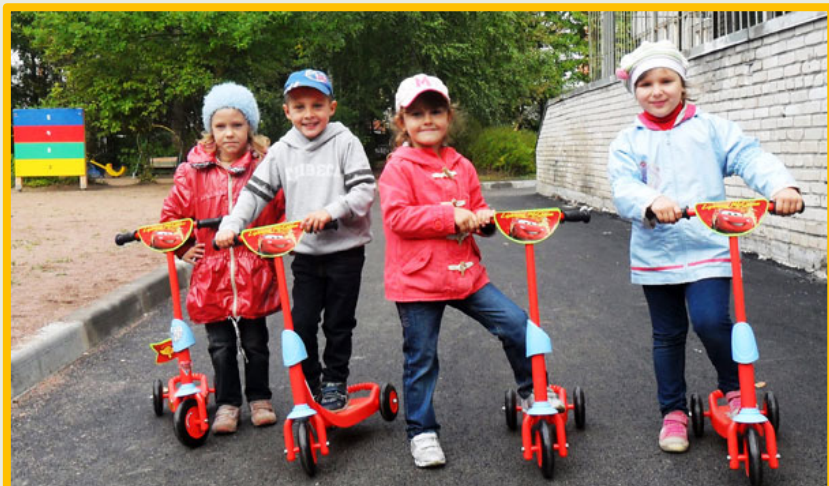
На прогулке мы теперь катаемся на самокатах!

для физической активности детей на участке имеется специальный спортивный инвентарь (мячи, обручи, санки, лыжи, самокаты)