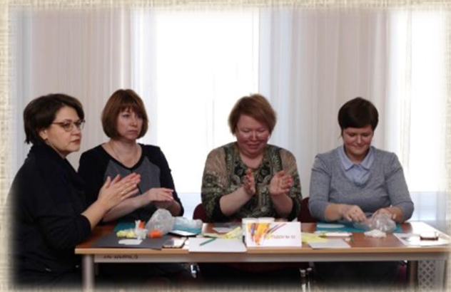
ГБДОУ детского сада № 32