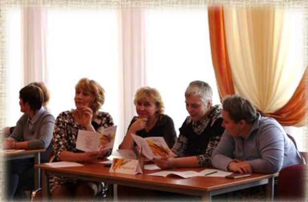
ГБДОУ детского сада № 126