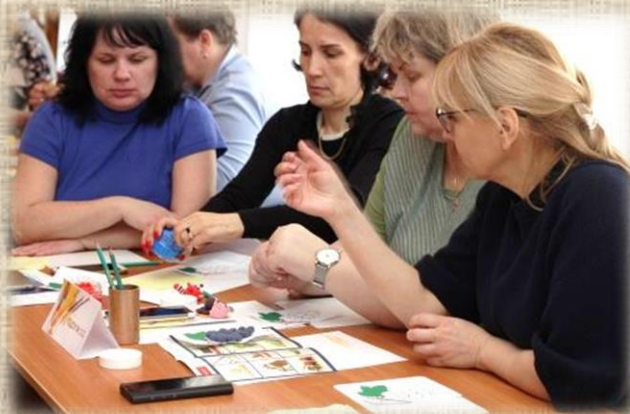
ГБДОУ детского сада № 111