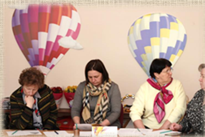
ГБДОУ детского сада № 64