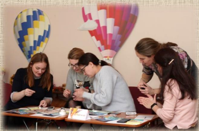
ГБДОУ детского сада № 107

В мероприятии приняли участие педагогические и руководящие работники: