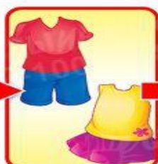
майка+шорты или платье