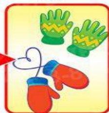
перчатки или варежки